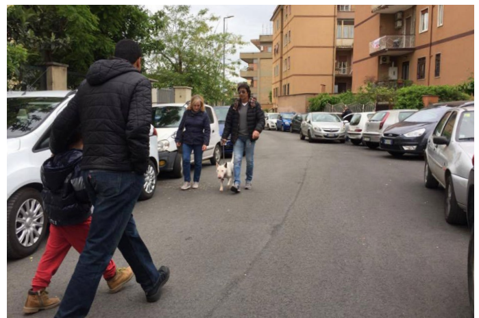
Un traffico lento e usi della strada distinti rendono lo spazio pedonale sicuro a Pineta Sacchetti

Tuttavia, dalle conversazioni con gli abitanti, emerge che la pedonalità non è un problema. Al contrario, i residenti descrivono Pineta Sacchetti a misura di bambini e anziani, e lo considerano un posto sicuro dove potersi muovere a piedi. Il quartiere ha infatti un sistema di circolazione viario ottimale: le strade di scorrimento e quelle commerciali si trovano sui bordi del quartiere, a pochi isolati di distanza dal centro dell'area che ha un flusso di traffico automobilistico molto contenuto. Di conseguenza l'interno del quartiere, prevalentemente residenziale, è poco trafficato e questo crea strade tranquille e adatte ai pedoni. Questo, associato a un tessuto sociale reso forte da istituzioni locali molto attive e competenti (scuola, centro anziani, biblioteca), rende il quartiere attraente e vivibile per i bambini e gli anziani.