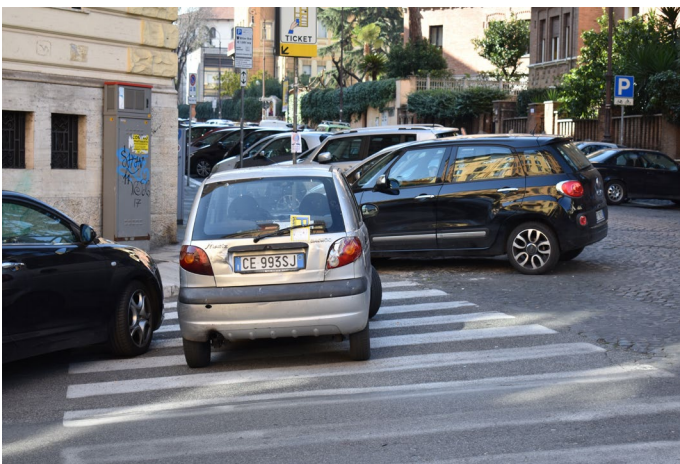
Automobili ostruiscono gli attraversamenti pedonali a Piazza Alessandria

Problemi di manutenzione e uso sono visibili ovunque nel quartiere: le auto parcheggiate ostruiscono le rampe; gli attraversamenti pedonali sono quasi completamente celati alla vista; le bancarelle bloccano interi marciapiedi. Ad esempio, nella strada che circonda il mercato rionale, meta abituale dei residenti più anziani, vi è un muro quasi impenetrabile di automobili parcheggiate che costringe i pedoni a camminare nella sede stradale. Limitare la sosta delle automobili potrebbe essere un'azione da manuale per favorire la pedonalità dell'area. Ma, ad oggi, gli usi osservati sembrano confermare la supremazia delle auto sui pedoni.